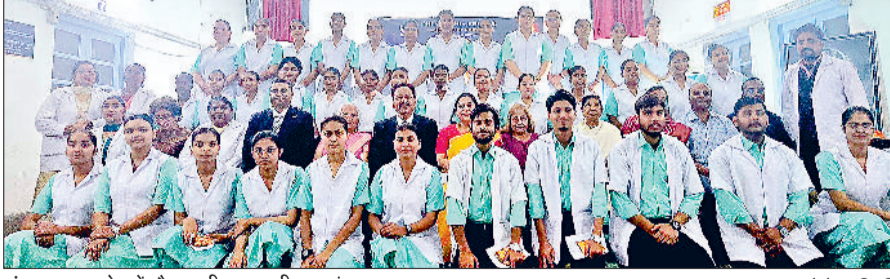
अंबाला। समारोह में मौजूद जीएनएम की छात्राएं।