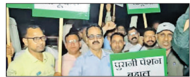
करनाल में मांगों को लेकर मशाल जुलूस निकालते एचएसईबी वर्कर्स यूनियन के कर्मचारी।